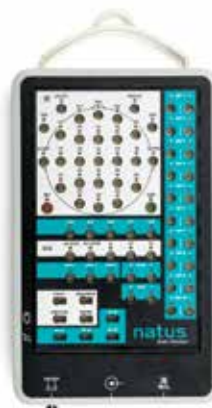
Natus Brain Monitor*

Amplificador versátil ampliable para diferentes opciones de pruebas