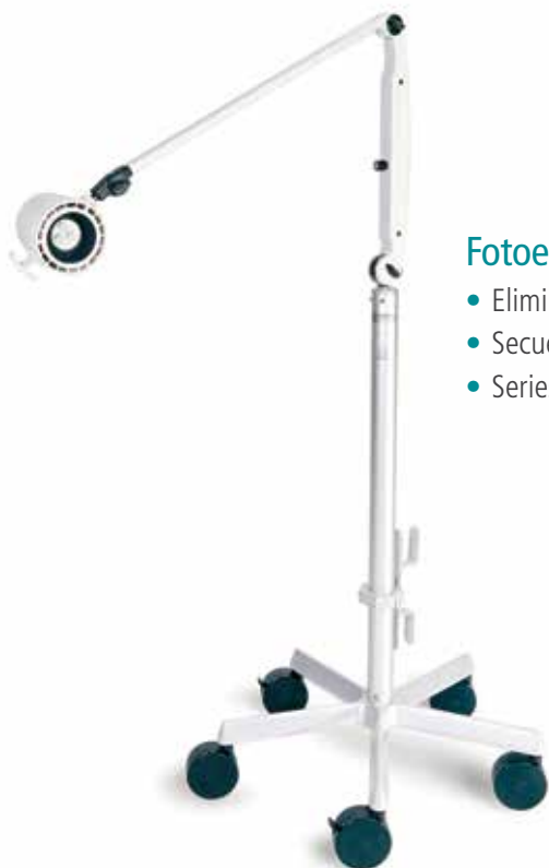
Fotoestimulador LED Natus